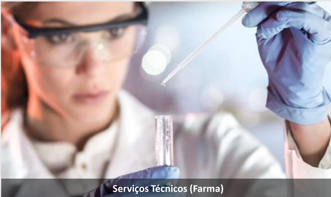
Serviços Técnicos (Farma)