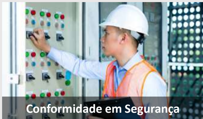
Conformidade em Segurança