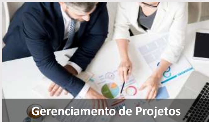
Gerenciamento de Projetos